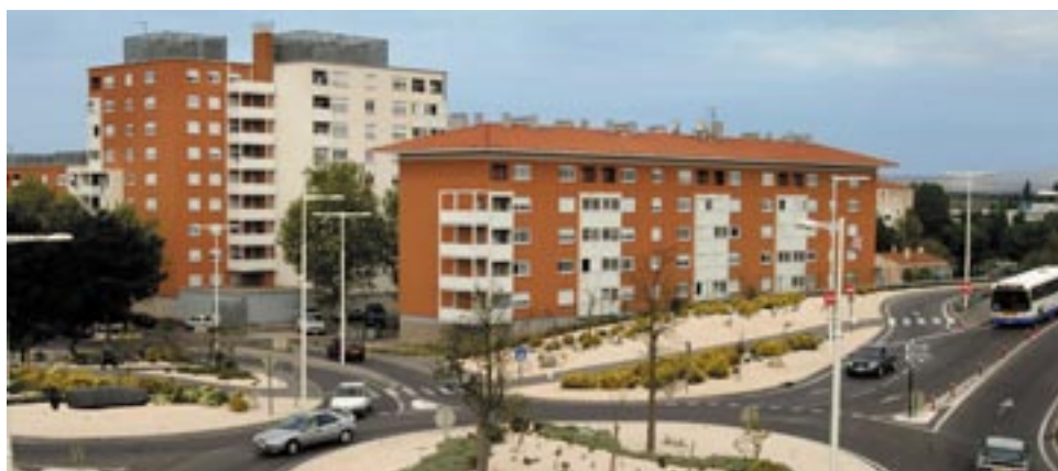
HLM quartier Clodion.

Perpignan Réhabilitation SA, pour remettre sur le marché des logements vacants, OPAH « Vivre en cœur de ville » pour aider, soutenir et conseiller les propriétaires de logements, action à laquelle s'est greffée l'« Action façades ». Le Plan d'Éradication de l'Habitat Indigne est venu compléter les dispositifs existants ainsi que le plan de sauvegarde des copropriétés Baléares/Rois de Majorque.