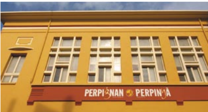
Salle des Libertés.