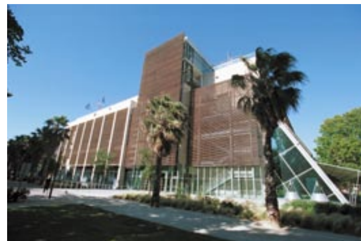
Palais des congrès.