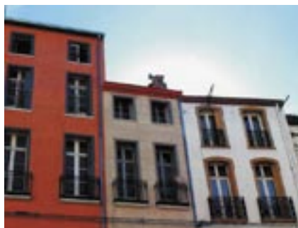
Façades rénovées place Rigaud.