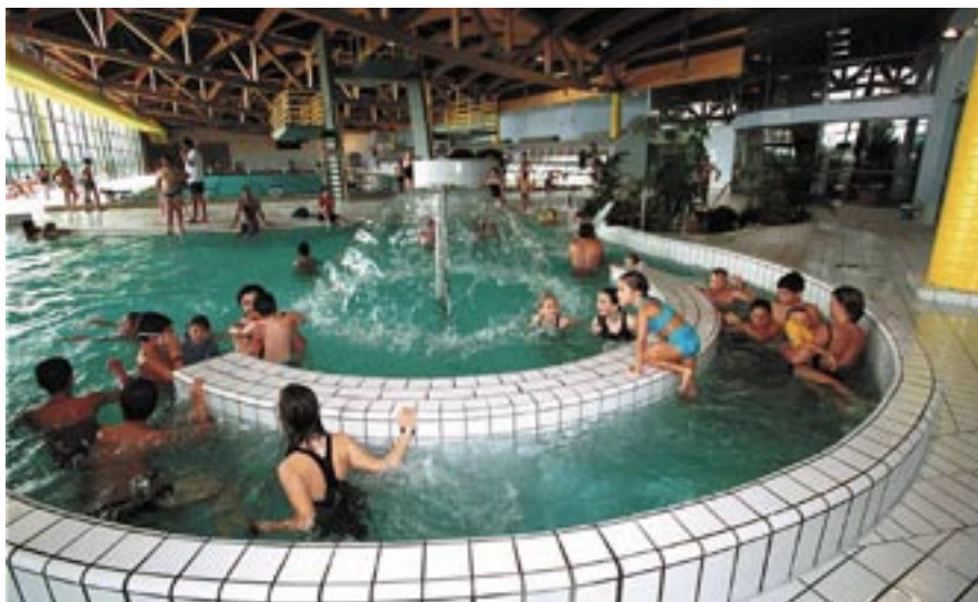
Piscine Espace aquatique.