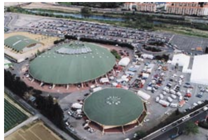
Parc des expositions.

Chiffres d'affaires 2005 : 1 M€, 10 000 m 2 répartis sur 7 niveaux d'espaces conviviaux, capacité d'accueil de 100 à 1100 congressistes, 36 congrès salons séminaires, 30 000 journées de congressistes, 15 salles de 15 à 200 places, 100 spectacles réalisés au Campo Santo, 156 manifestations locales, 214 manifestations Ville, 30 associations résidentes au palais des congrès.