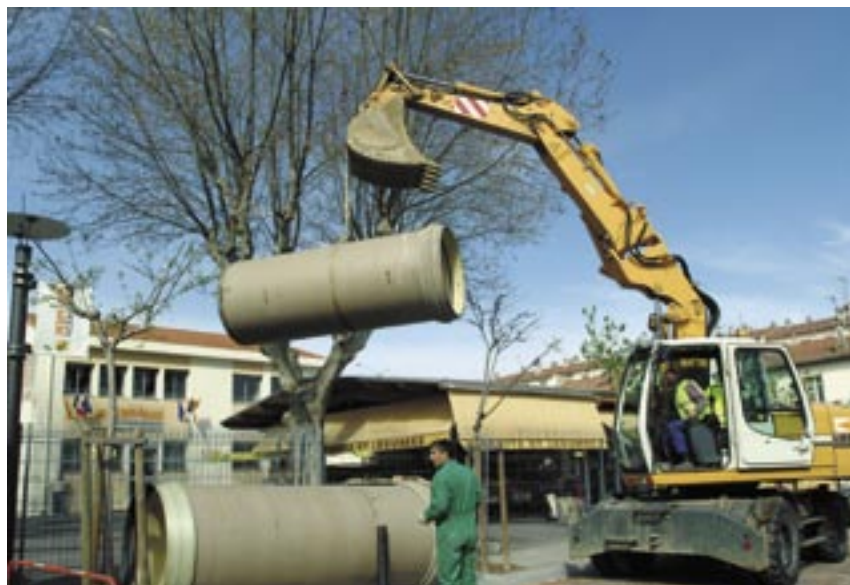
Nouveaux réseaux hydrauliques avenue Joffre.