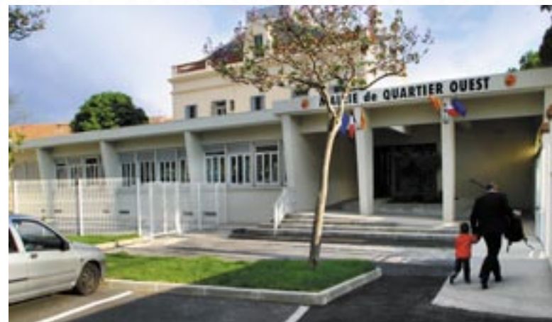
Mairie de quartier Ouest.