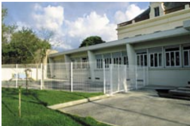
Crèche Joan Miró.