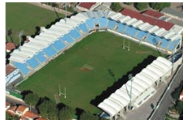
Stade Aimé Giral.