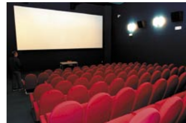
Institut J. Vigo.